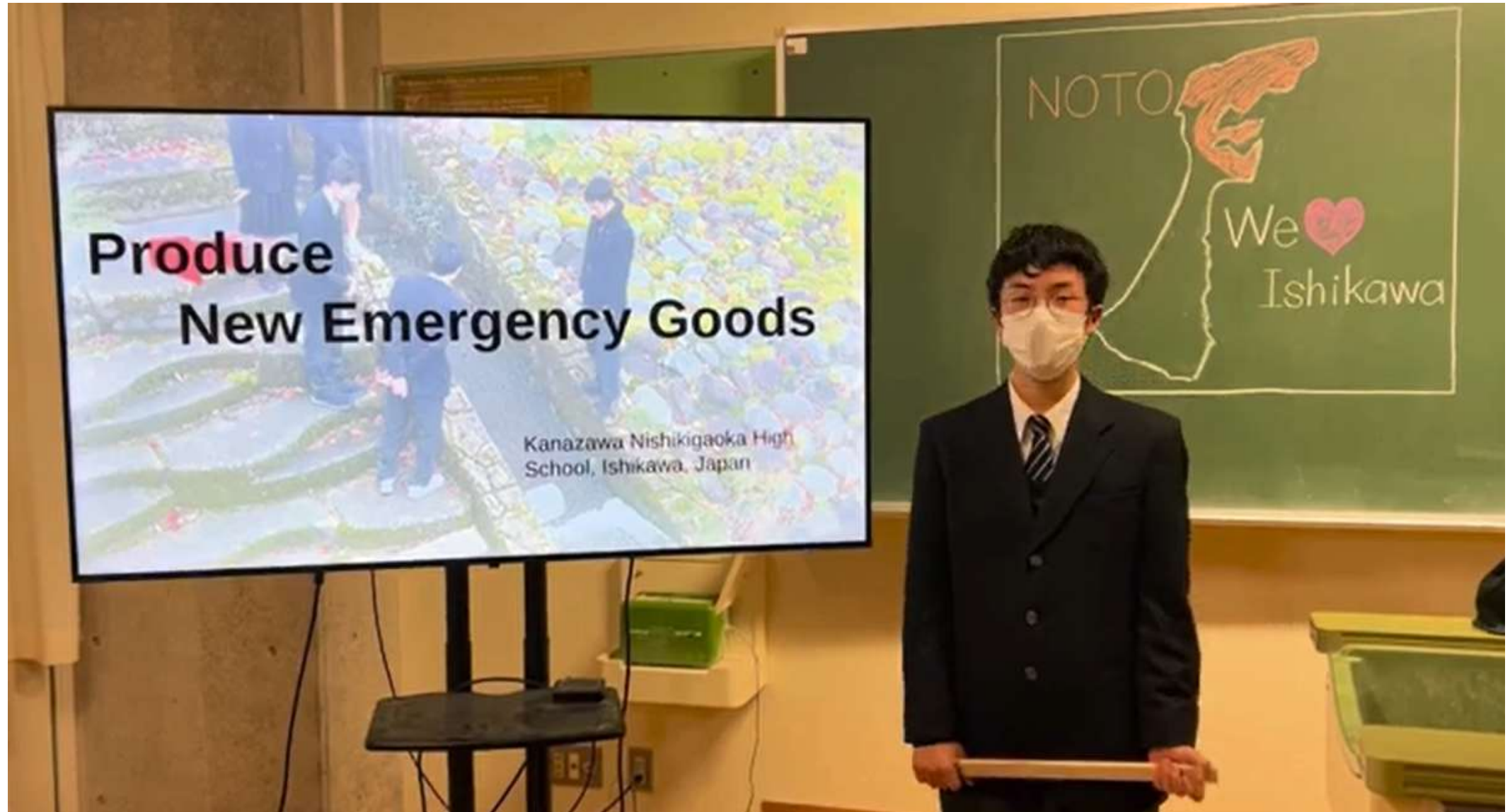
応募動画冒頭のスクリーンショット