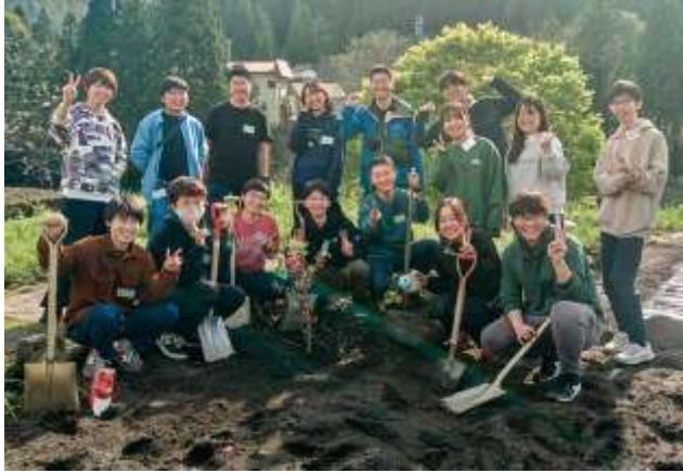
白山手取川ジオパーク水リレー