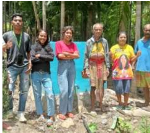
インドネシア西ティモール